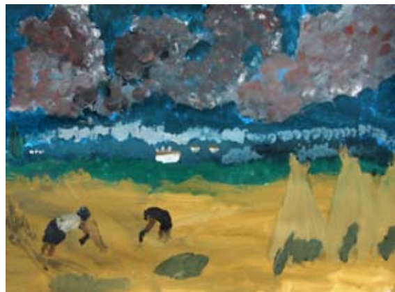
Žiga Strmšek, 6. a