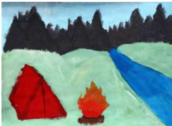
Tjaša Polanec, 9. b