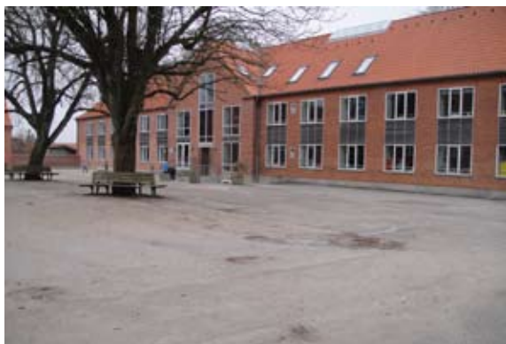
Šola v Herningu, Danska