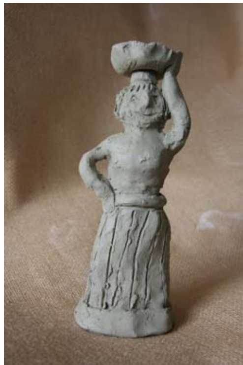
Rebeka Šnofl, 7. b