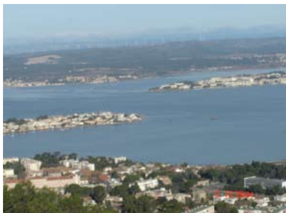
Obmorska pokrajina (v ozadju vetrne elektrarne)