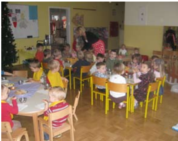
V prazničnem vzdušju nam tudi zajtrk zelo tekne.

... prelepe praznične dni v mesecu decembru. Bilo je veliko smeha, rajanja in lepih doživetij, ki se jih bomo radi spominjali. Okrasili smo vrtec, veliko smo se družili z ostalima skupinama in med nami se tkejo prave prijateljske vezi. Izdelovali smo voščilnice, darilca za naše starše in seveda obiskal nas je Božiček, ki smo se ga vsi zelo razveselili. Ja, veseli december je bil res vesel.