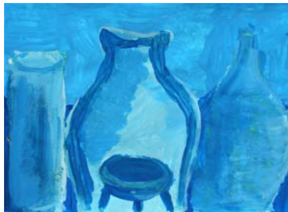
Žiga Živko, 9. b

Delali bi snežaka, se kepali, imeli ga za junaka in se ne pretepali. Ptičem hišico zgradili, noter hrano nanosili. Dom svoj uredili, ga popestrili in uživali ter praznovali.