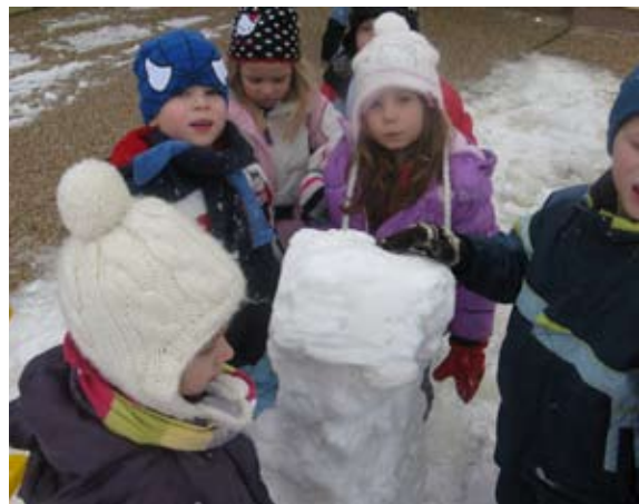
Stolp je kar rasel.

prosto tekanje po snegu in obmetavanje s kepami.