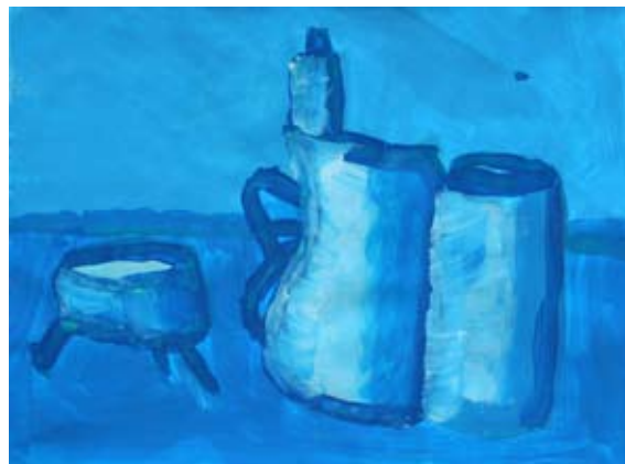
Tomi Kramberger, 9. a

hišo sneg, seveda je mislil, da je sol, in jo takoj poskusil. Imela je drugačen okus in Butalec je mislil, da je našel drugo vrsto soli. To novico je raznesel po vseh Butalah in ko se je vrnil domov, je sneg že skopnel in o soli ni bilo niti sledu več.