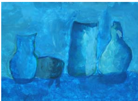
Tina Nemec, 9. b