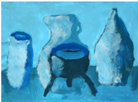
Klemen Ahmetović, 9. b