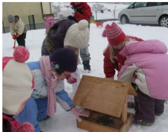
Skrbimo za ptičke, da ne bodo lačni.

Nismo pa pozabili niti na živali, ki jih sneg ni razveselil tako kot nas. V ptičjo krmilnico smo jim natesli zrnja in tako poskrbeli, da ne bodo lačni zaradi bele odeje, ki je pokrila pokrajino.