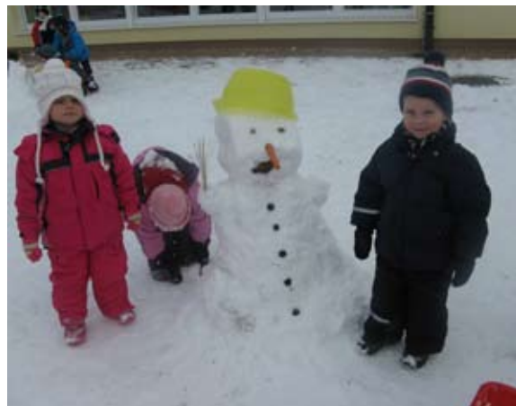
Izdelali smo snežaka.

Na snegu smo bili pravi ustvarjalci. Pred vrtec smo postavili snežaka in stolp, a največje veselje je bilo pre-