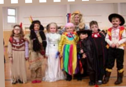
veliko različnih pustnih mask,