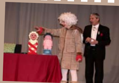
Čarovniški triki in