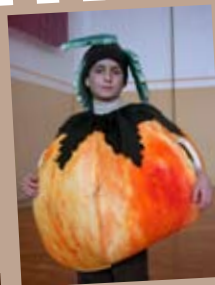
najboljše in jih nagradili.