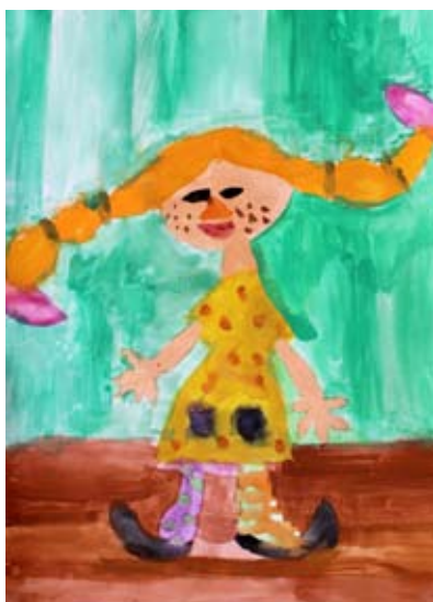
Neža Klemenšak, 2. a