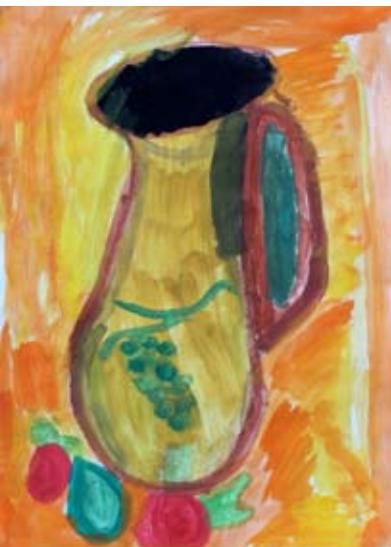
Lan Preložnik, 1. b