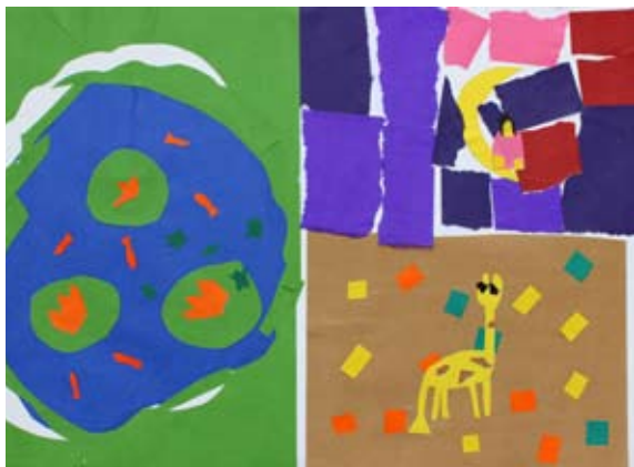
Nika Čuček, 5. b