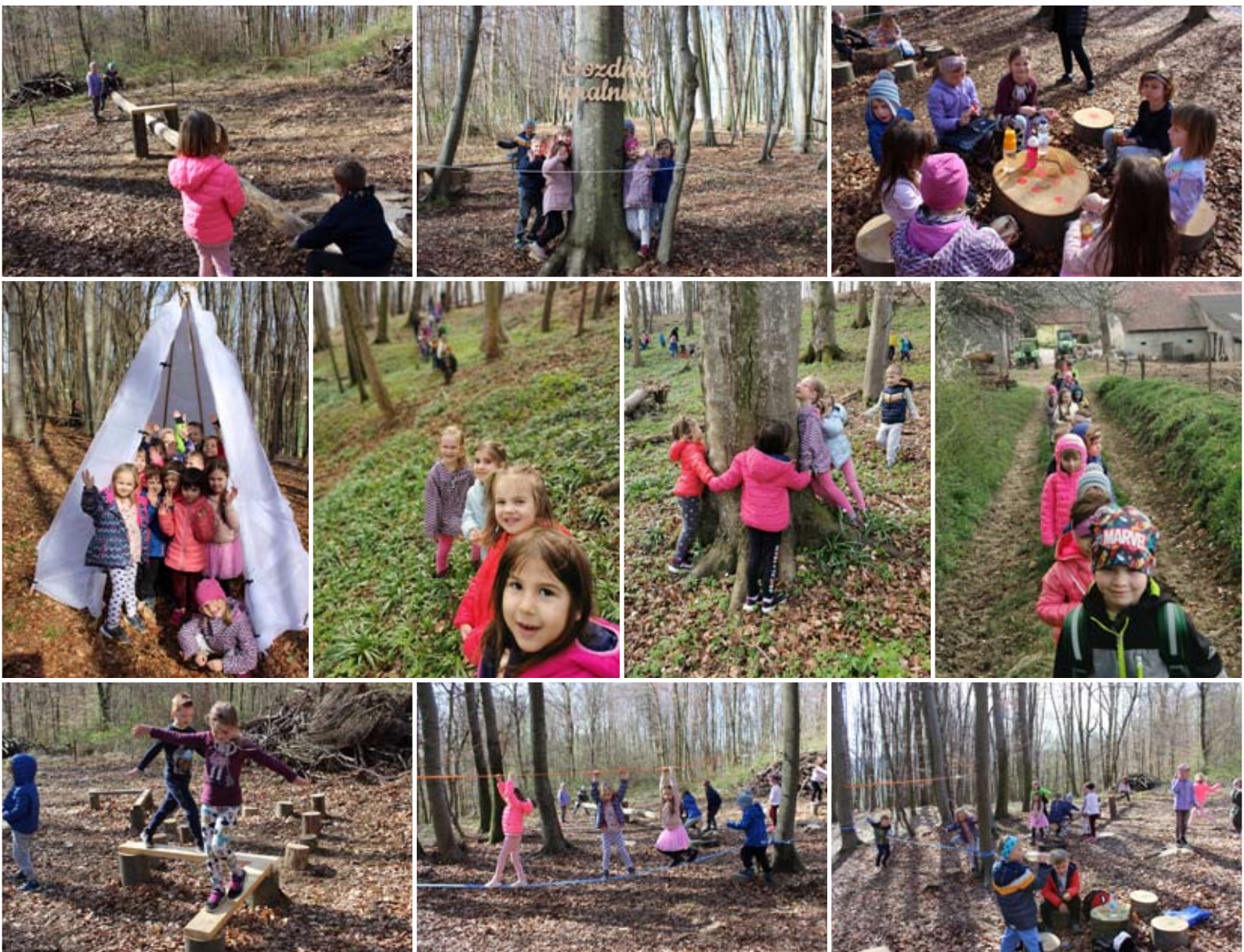
Otroci z vzgojiteljicama skupine Utrinki

V GOZDU IGRA ČUDOVIT ORKESTER, NJE-GOVA GLASBA NAS SPROŠČA, UMIRJA IN NAPOLNI S PRAV POSEBNO ENERGIJO. ČE VAS ZANIMA S KAKŠNO – POJDITEV V GOZD, SAJ TAM DOŽIVITE TO ČAROVNIJO.