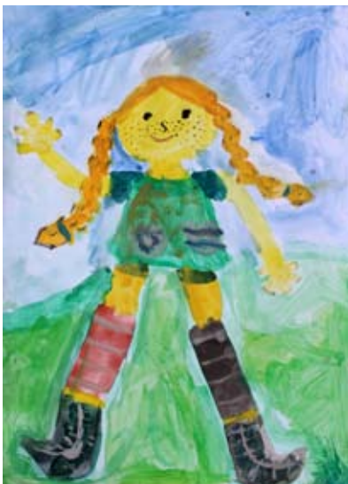
Mija Čuček, 2. a