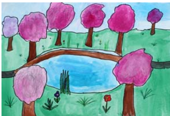
Lina Erman, 9. b

zvonček in si zaželela, da bi moja mati ozdravela, da bi dobila čopiče in barvo ter da bi s škratom našla pot iz gozda. In to se je tudi zgodilo. S škratom sva našla pot iz gozda, čez en teden je bila mati čisto zdrava in v moji sobi me je čakal komplet za slikanje. S škartom sva postala najboljša prijatelja in vsak konec tedna sem obiskovala njegovo luknjo. Škratu sem bila zelo hvaležna, da mi je pokazal pot.