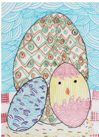
Matic Kunštič, 7. a