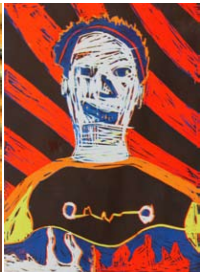
Luka Simonič, 7. a