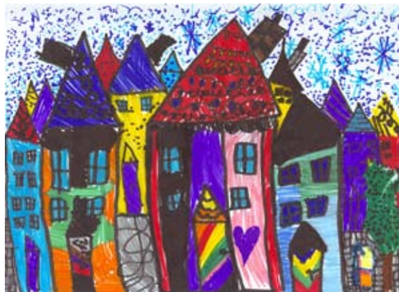
Nerdživana Hajrizi, 2. a

Prav tako se želim zahvaliti vsem drugim krajanom, ki obiščete otroke oz. učence in jim pripovedu-