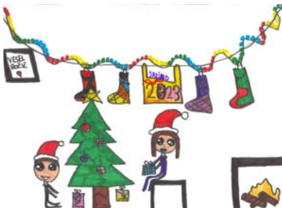
Nika Poštrak, 2. a