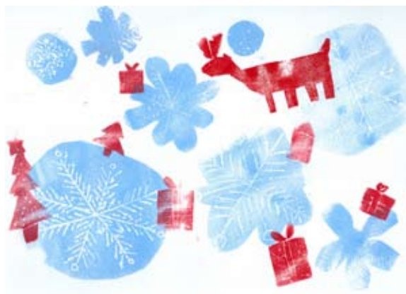
Učenci likovnega krožka, 3.–5. razred