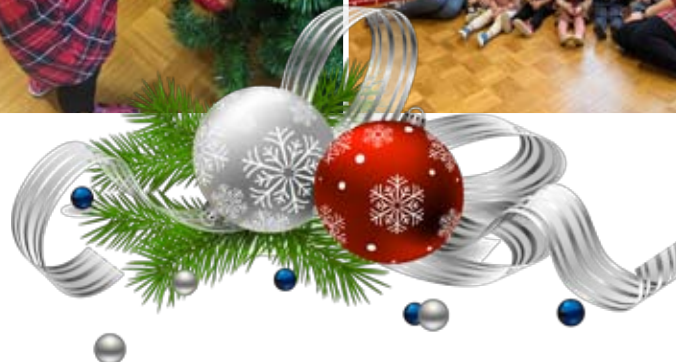
Otroci z vzgojiteljicama skupine Lunice