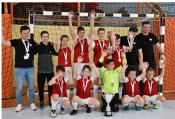
3. mesto na državnem tekmovanju v futsalu U13

atletiki med mlajšimi dečki v teku na 300 m osvojil 1. mesto in se uvrstil na državno tekmovanje, kjer je z odličnim rezultatom 41,14 s osvojil 2. mesto, mentorica Petra Cvikl Marušič.