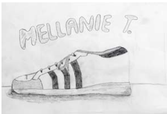
Mellanie Trinkaus, 8. a