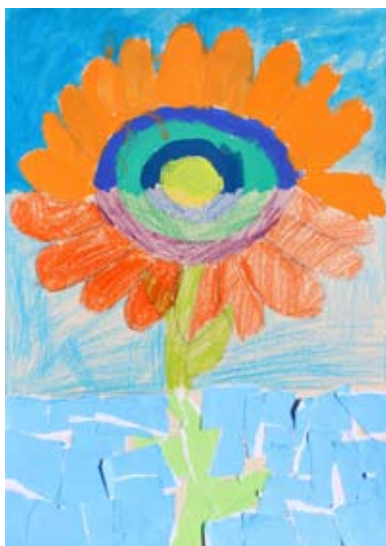
Vito Zaveršnik Trojner, 3. a