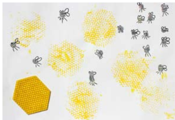
Tine Kolar, 6. let