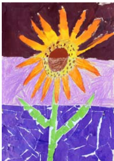
Tai Toplak, 3. a