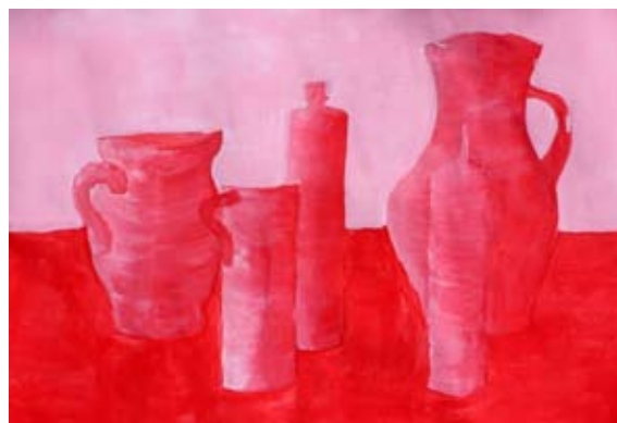
Neža Štruc, 8. a

dentov, saj je bil organiziran tehniški dan z naslovom Igriva arhitektura. Po uvodnih predavanjih in pogovorih so sledile praktične in igrive delavnice. Predavateljice so na poučen in igriv način učence seznanile o razumevanju prostora, globalnem segrevanju in trajnostno urejenem prostoru.