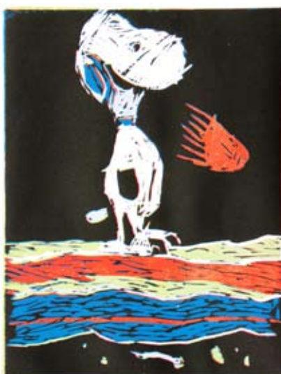
Vito Egghart, 7. b