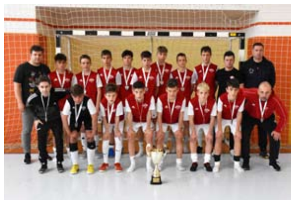
2. mesto na državnem tekmovanju v futsalu U15

Veseli me dejstvo, da je stanje v vrtcu in šoli (po moji oceni) dobro. Opažam, da učenci v zadnjih mesecih veliko pozdravljajo in so prijazni med seboj. Zaposleni na šoli moramo biti pri svojem delu z otroki