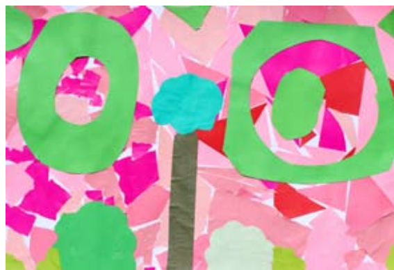
Maruša Vrčko, 8. a

a, 8. a in 8. b pa 2-krat. Učenci 1. a, 2. a, 3. a, 4. b niso bili napoteni v karanteno. Prav tako sta bili v karanteno napoteni dve skupini v vrtcu, in sicer Snežinke 2-krat in Zvezdice 1-krat.