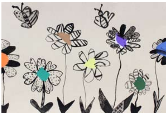
Žana Simonič, 2. a