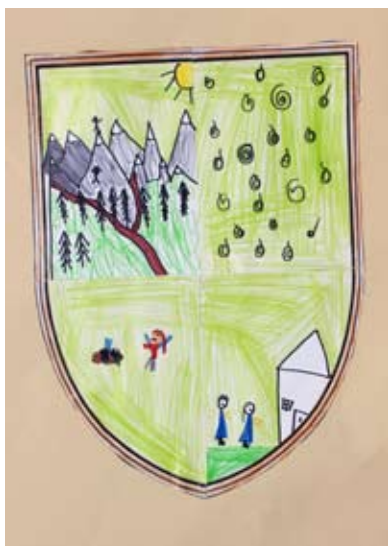
Lucija Svenšek, 1. a