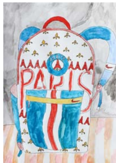
Ian Škamlec, 6. a