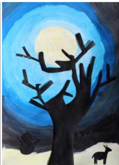
Tia Toplak, 4. b