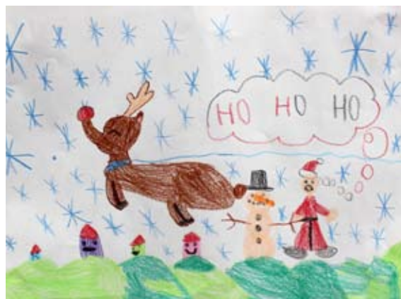
Maša Klevže, 2. a

Pisatelj se je po nakupih odpravil z bratom in očetom. Izbira je bila zelo skromna, prav tako je nakup