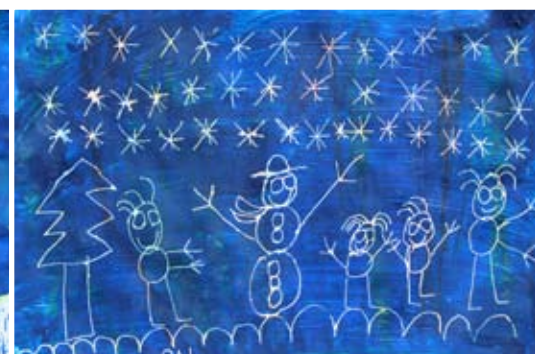
Gal Jug, 1. a

I hope that in 2022 covid will disappear. I would like my parents to have more time for me. I hope I will visit France with my family. I wish to have better grades.