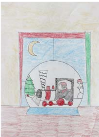
Ian Škamlec, 6. a