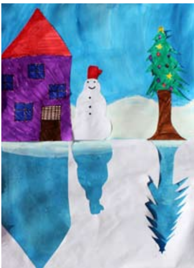
Neža Fras, 4. a