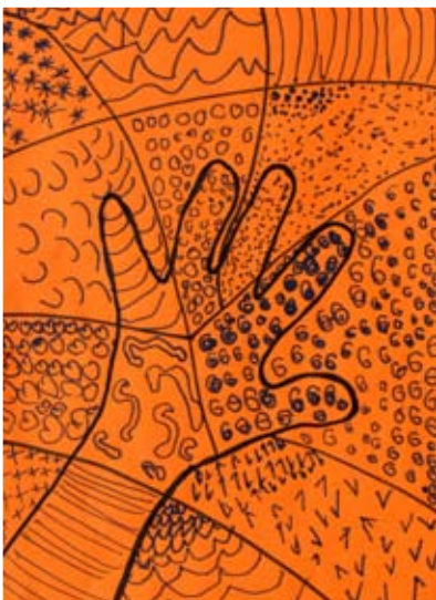
Mija Čuček, 1. a