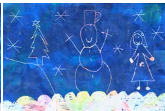
Neža Klemenšak, 1. a