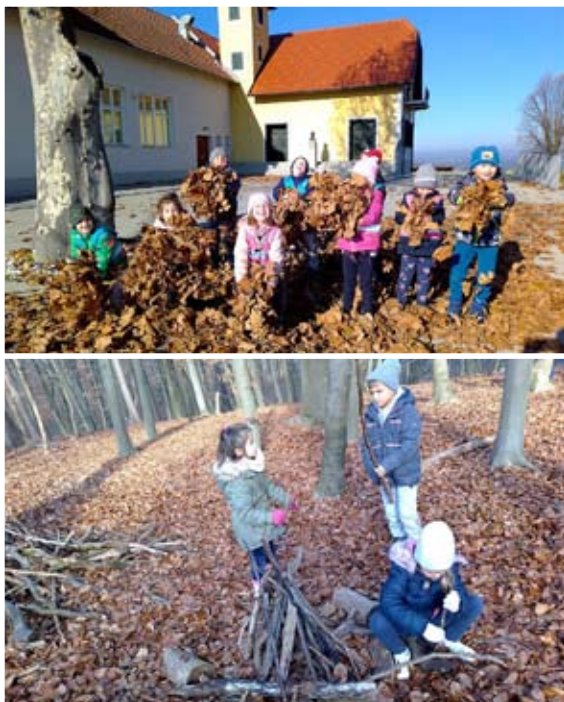
Učilnica v naravi – narava kot stimulatívno okolje za zgodnji razvoj jezika

V okviru projekta se razvija generični model, pripravlja in izvaja program treninga ter pripravlja priročnike za spoznavanje inovativnega poučevanja v naravi in razvijanje sporazumevalnih zmožnosti, ki bodo obogatili pedagoški proces.