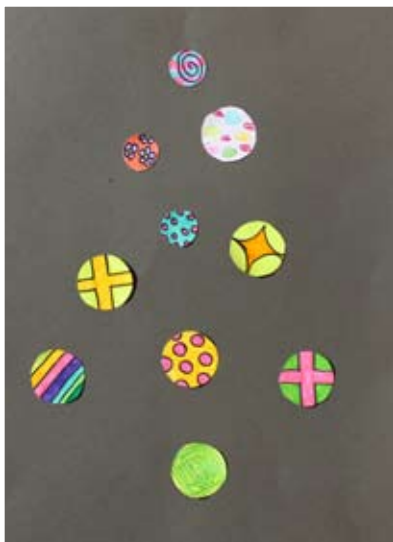
Ela Klara Črešnar, 5. a