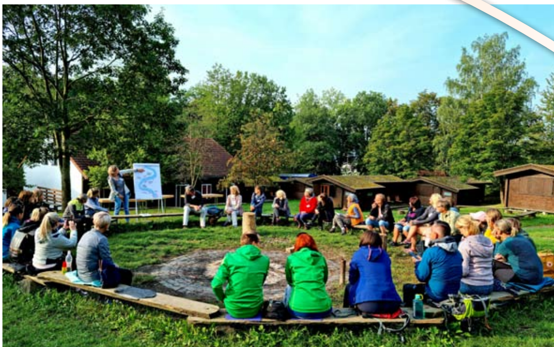
Delovno srečanje partnerjev projekta v Marburgu v Nemčiji

ELaDiNa - Early Language Development in Nature projekt poteka od septembra 2020 do avgusta 2023. Nosilec projekta je CŠOD.