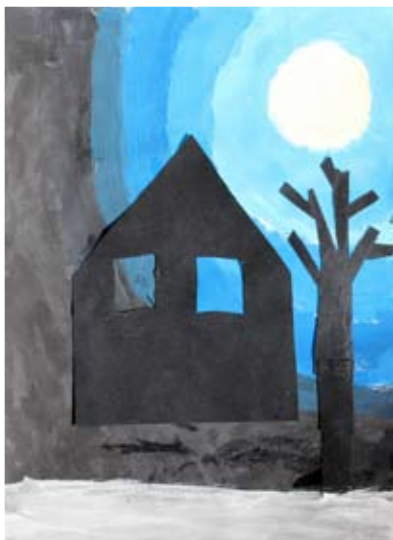
Tija Žnidarič, 4. b