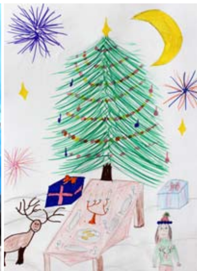
Merjema Aščerić, 7. b