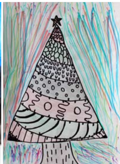
Taja Fistrovič, 5. a