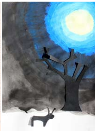
Paskal Rojko, 4. b