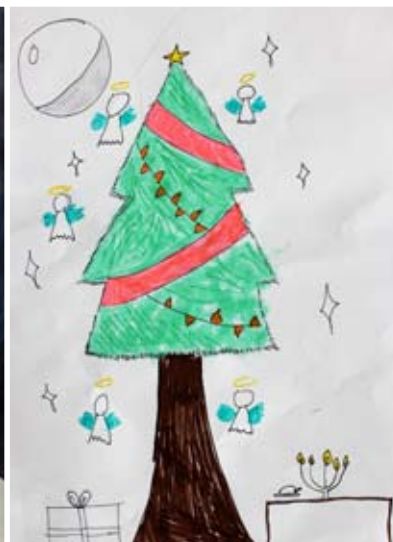
Anamari Klobasa, 7. b