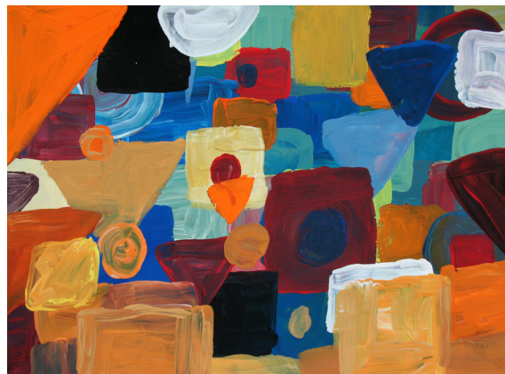
Nejc Sekol, 6. b