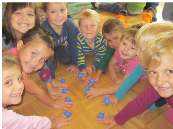
Otroci s slončki na prstu

Da smo mali umetniki, naj bo tudi znano. Kar pogledajte, tako nastajajo naše velike umetnine.