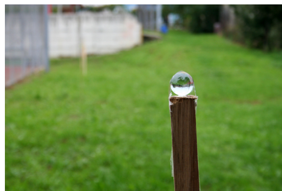
Planet Neptun, ki je pomanjšan na velikost frnikule.