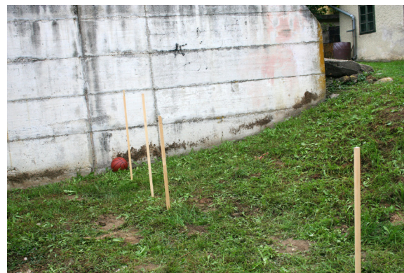
Osončje s košarkarsko žogo kot soncem in pripravami (palicami) za planete.