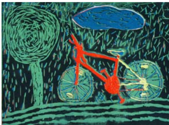
Bojan Krajnc, 7. a