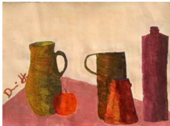
Daniel Hegedič, 9. b

bil živ pujsek. Bilo je veliko ljudi. Tam sem spoznala deklico Ulo. Ko sem jo vprašala, kako ji je ime, je rekla Ula prdula. Tam smo kuhali neko juho iz jabolk, koruze, vode in listov.