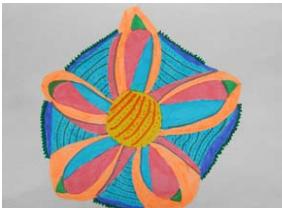
Zala Jug, 7. a