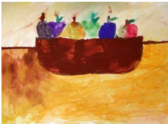
Hana Pivljakovič, 3. b

Zvezda, zvezda, zvezdica, kje si se skrivala? Luna, luna, lunica, celo noč je svetila. Mami, mami, mamica, k meni je prišla in me nežno božala.