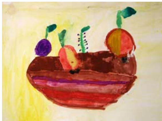
Sergeja Hameršak, 4. b