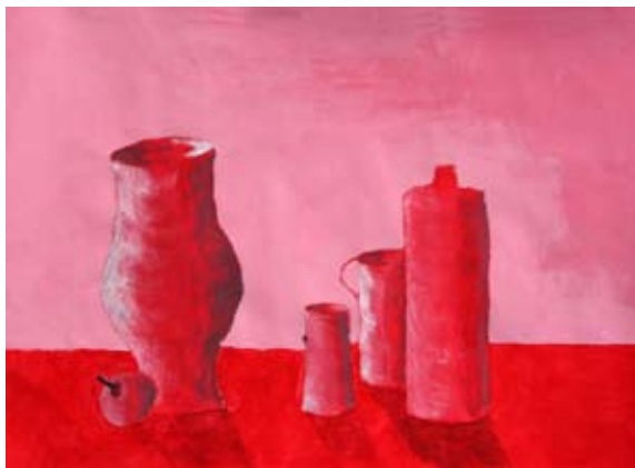
Tadej Kurnik, 9. a