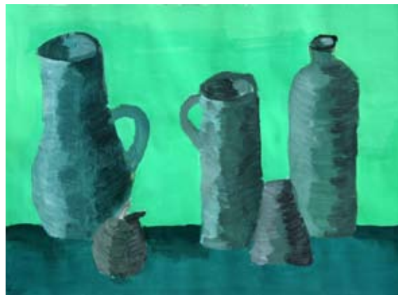
Saška Kurnik, 9. a

Ne mara pa zime, ker je polno teme. Nositi mora šal in rokavice. Žalosten je, ker ne vidi nobene cvetice.