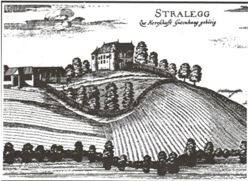
Dvorec Štralek v Voličini, v katerem bi naj prebivala Agata

Poleg te zgodbe, pa so v zvezi z gradom Hrastovec povezani številni čarovniški procesi, ki so se pogosto končali s smrtnimi obsodbami obdolžencev. Obsojene na smrt v gospostvu Hrastovec so usmrtili na morišču pri Sv. Lenartu. To morišče se je nahajalo na pašniku ob Velki. Zadnja usmrtitev je potekala julija 1773.