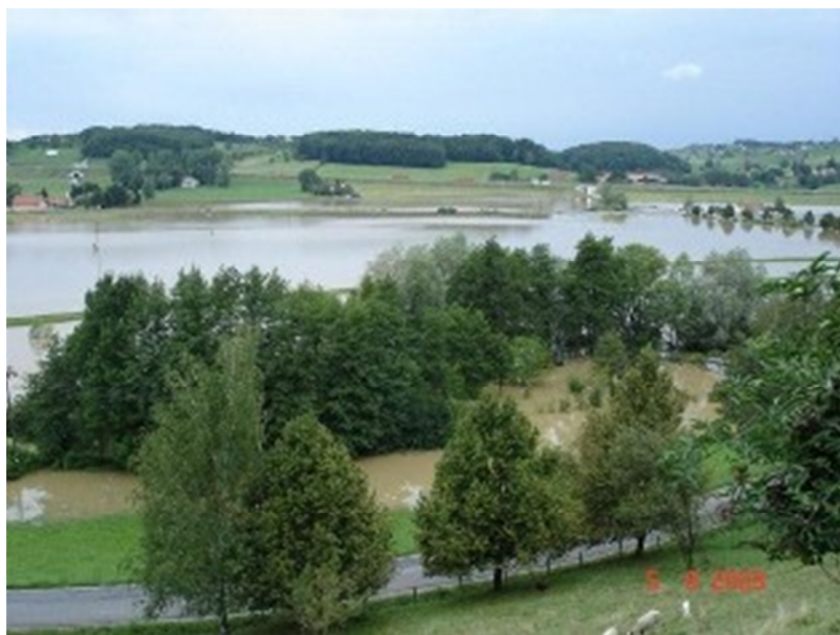
Reka Pesnica ob močnejših nalivih pogosto prestopi bregove

Podnebje občine Lenart je prehodno panonsko celinsko. Značilnost podnebja v Slovenskih goricah in občini Lenart je pogosto pojavljanje temperaturnega obrata oziroma nastajanje termalnega pasu. Do temperaturnega obrata prihaja v jasnih in mirnih nočeh, ko se hladen in težak zrak steka po pobočjih v doline in zaprte kotanje. V dolinah in kotlinah se tako zadržuje hladen zrak. Toplejši zrak pa se nahaja v višje ležečih predelih. Prav zaradi tega je število dni s slano in pozebami v občini Lenart višje v dolinah in kotlinah kot na vrhovih slemen. Pozebe pa predstavljajo težavo predvsem v pomladanskih mesecih, ko pridejo rastline v fazo brstenja. Prav zaradi je vinska trta v Slovenskih goricah bolj razširjena v višje ležečih predelih. Spodnja meja vinske trte v občini Lenart se pojavlja na 280 m n.v.