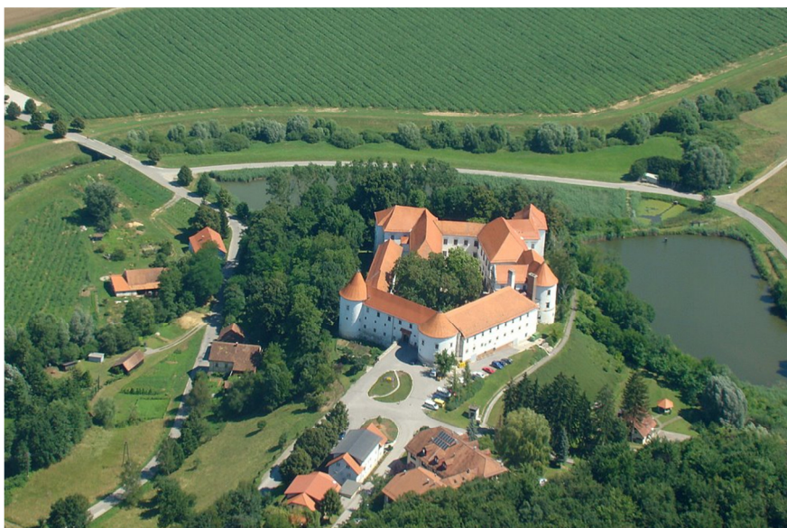
Mogočna peterokraka zasnova gradu