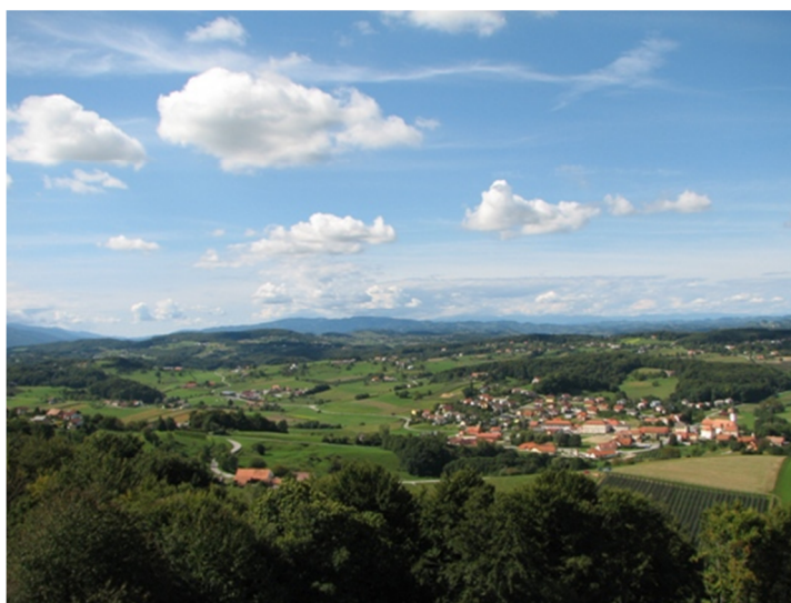
Pogled iz razglednega stolpa (slika levo) na razgibane Slovenske gorice (slika desno)

Naporen in pester dan bomo sklenili v bližini Maistrovega stolpa ob ogledu kmečkega muzeja Kranvogel na Zavrhu. Raznovrstno kmečko orodje, pripomočki iz preteklosti, starodobna vozila in zanimive animacije na katere naletimo v muzeju nas bodo zlahka popeljale v preteklost.