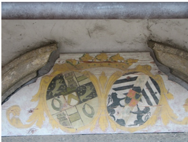
Grb Herbersteinov še vedno krasi portal nad vhodom v nekdanji špital

Leta 1625 je lenarški trški sodnik Maks Bernhardt ustanovil špital v Lenartu. V svoji oporoki je namreč dal zapisati, da morajo imeti v njem oskrbo vsi obubožani in bolehní tržani. Prav tako je v oporoki vso svoje premoženje zapustil izgraditvi in delovanju špitala. V prvotni obliki je bilo v špitalu prostora za 6 ljudi. Leta 1661 je špital, ki je dobil ime Špital Sv. Duha, obnovil in povečal grof Erazem Herberstein ter prevzel patronat nad njim. Po obnovi je bilo v njem prostora za 8 oskrbovancev. Pritlično stavbo te zgradbe še danes na portalu krasi na les naslikani grb Herbersteinov. Špital je poleg Rotovža edina stavba v trgu, ki je preživela številne požare med 17. in 19. stoletjem.