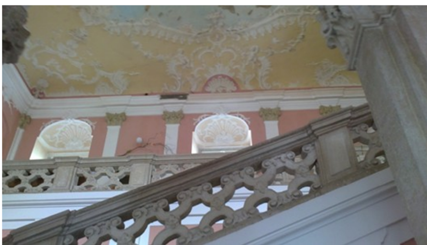
Baročni hodnik v severnem delu gradu, ki je bil namenjen pomembnejšim članom družine

Grad je bil delno preoblikovan še v začetku 18. stoletju. V stilu zrelega baroka je bilo oblikovano stopnišče z mogočnim vhodnim portalom in plastično podobo slopov ter vrsto štukatur v sobah.