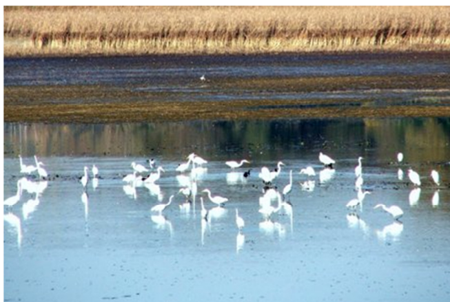
Jezero Komarnik – pomembno gnezdišče nekaterih redkejših vrst ptic

Zaradi plitvih vodnih strug in mokrotnih tal so v Pesniški dolini pogoste tudi poplave. Za razliko od prekomerno namočenih dolin vode primanjkuje na vrhovih slemen, ki so veliko bolj sušna, od sosednjih dolin. Poplavljanje Pesniške doline so skušali omejiti z melioracijami in umetnimi akumulacijskimi jezeri. Tako so poleg jezera v sosednji občini Sv. Trojici v občini Lenart nastala še jezero v Radehovi, in Močni («Šikerjevo» jezero). Med tem, ko je jezero Komarnik nastalo že 16. stoletju, ko je Hrastovškim gospodarjem služilo kot ribnik. Vsa jezera, razen zadnjega nudijo danes odlično možnost za razvoj ribiškega turizma, vendar bi po mnenju domačih ribičev morala biti deležna precejšnje obnove. Predvsem v smislu čiščenja jezera in obnove zaroda v njem.