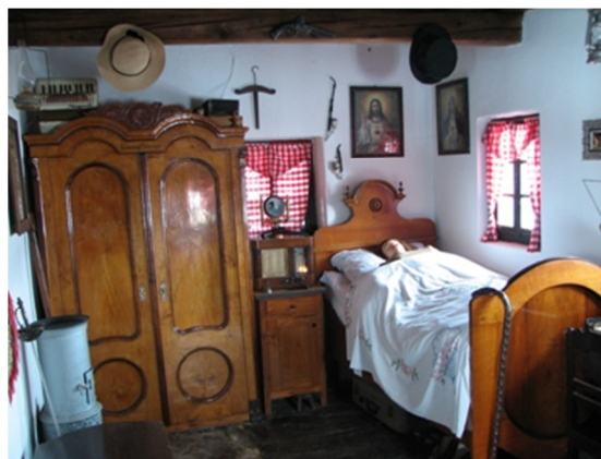
Kmečki muzej Kranvogel na Zavrhu nas popelje v življenje v 19. stoletju na podeželju

Pred odhodom domov pa priporočamo še večerjo v enem izmed številnih domačih gostinskih lokalov ali kmečkem turizmu, kjer bomo poleg okusne hrane strnili vtise nepozabnega dne v odkritem biseru Slovenskega turizma – v osrčju Slovenskih goric.