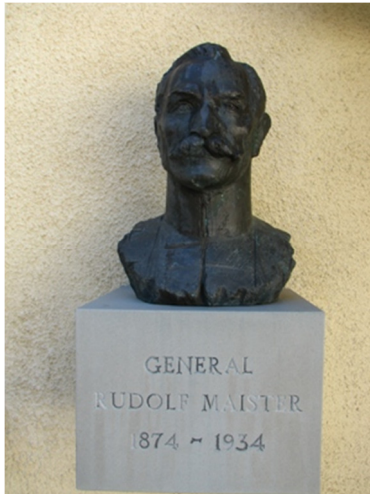
Spomenik Rudolfu Maistru Vojanovu na Zavrhu, kjer je po upokojitvi nekajkrat obiskal prijatelja Franja Stupico

Schutzwehr, kar je pomenilo, da je Maribor z okolico, vključno s Slovenskimi goricami del slovenskega ozemlja.