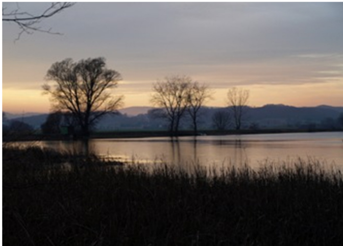
Vznemirljiva, pot od gradu Hrastovec do Črnega križa pelje mimo jezera Komarnik

Eden najlepše ohranjenih gradov na Slovenskem – grad Hrastovec je naša naslednja postojanka. Grad se prvič omenja leta 1265, ko je bil njegov gospodar Günter Hrastovski. Gospostvu Hrastovec, oz. gospostvu Gutenhaag, kot je bilo njegovo ime v preteklosti je dolga leta gospodovala družina Herberstein, ki je tako dala svoj pečat razvoju Slovenskih goric skozi čas. Kaj več o preteklosti gradu in skrivni ljubezni med Agato in Friderikom pa boste izvedeli ob ogledu viteške dvorane in kapele Sv. Križa v grajskem poslopju.